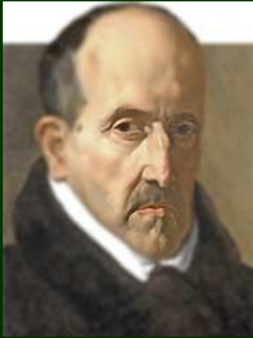
Luis de Góngora 1551 - 1627