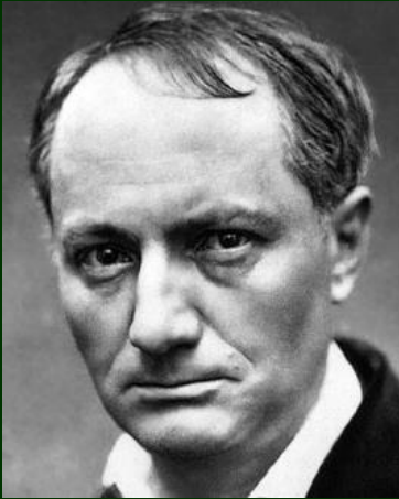
Ch. Baudelaire 1821 - 1867

Deslumbrado, el insecto vuela hacia ti, candela. Crepita, estalla y dice: "¡Bendigamos la antorcha!". El amante jadeando sobre su bella amada, parece un moribundo que acaricia su fosa